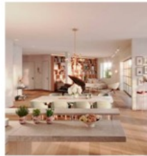
25 weitere Wohnungen sind jetzt auf dem Markt.

ternehmung der WI Baurträger GmbH, die die betroffenen Gebäude zwischen der Favoritenstraße 58–60 und der Graf-Starhemberg-Gasse 31 „nach einem modernen stadtplanerischen Ansatz für eine gemischte Nutzung“ entwickeln will. Konkret bedeutet das, dass hier 75 Wohnungen – angefangen bei City-Apartments über Alt-